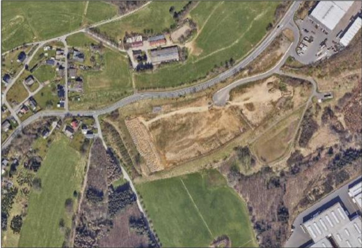
Abb. 5: Luftbild des Geltungsbereichs der 2. Änderung des Bebauungsplanes Nr. 266 (Stand 2022)