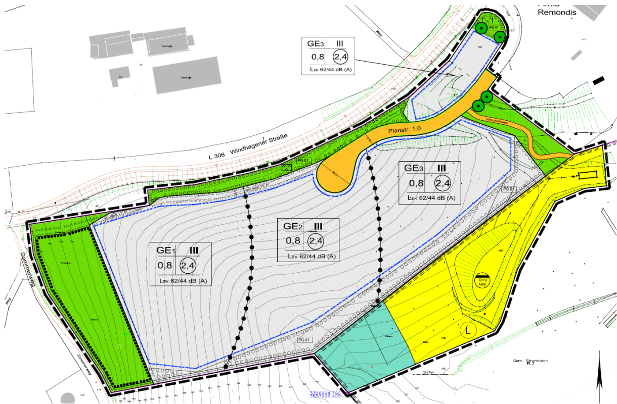
Abb. 3: Auszug aus dem Bebauungsplan Nr. 266 „Gewerbepark Sonnenberg – Nord“

Die 1. Vereinfachte Änderung des Bebauungsplans Nr. 266 „Gewerbepark Sonnenberg – Nord“ passte den Bebauungsplan an die räumlichen Gegebenheiten an. Die Veränderungen beliefen sich auf Festsetzungen zur Art der baulichen Nutzung, zu Baugrenzen und zu Umgrenzung von Flächen zum Anpflanzen von Bäumen, Sträuchern und sonstigen Bepflanzungen.