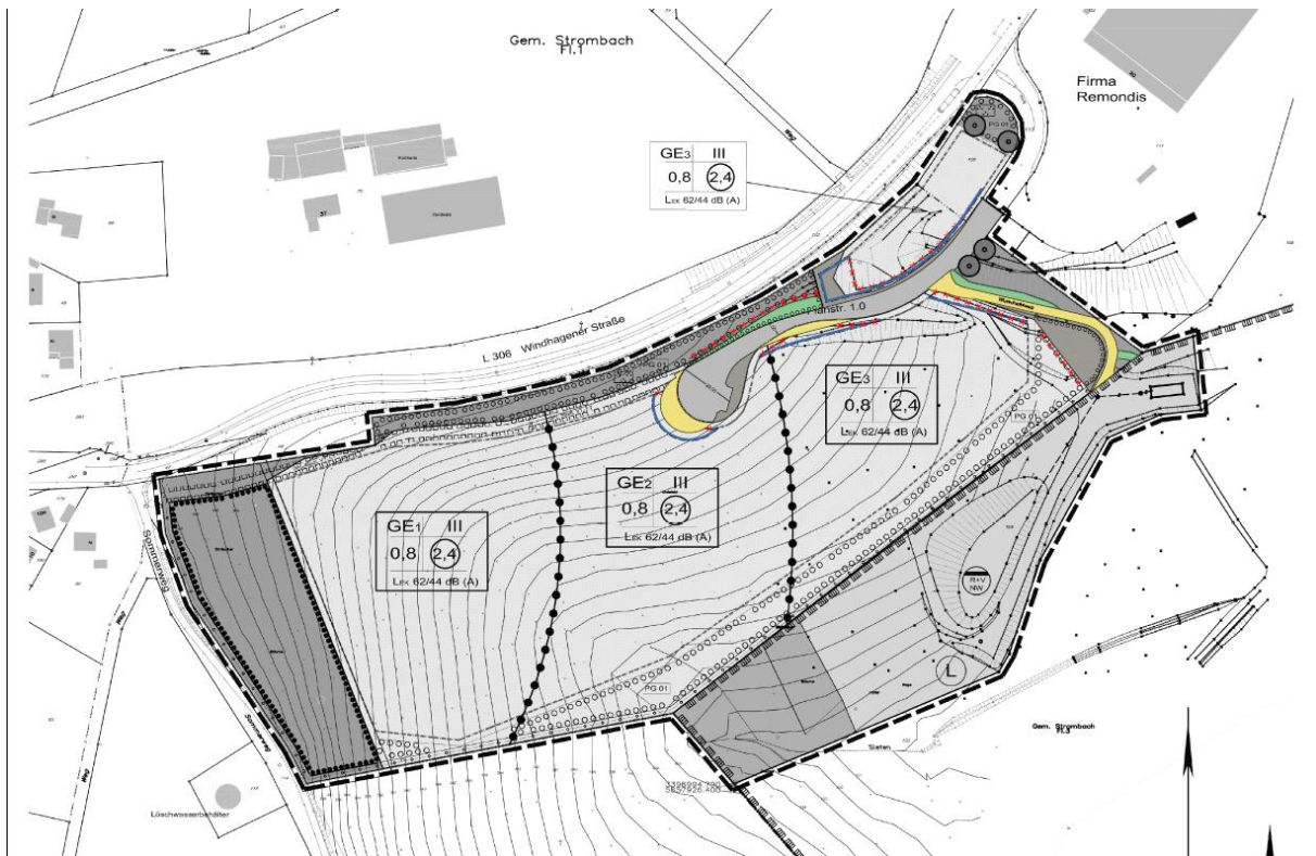
Abb. 4: Auszug aus der 1. Änderung des Bebauungsplan Nr. 266 „Gewerbepark Sonnenberg – Nord“