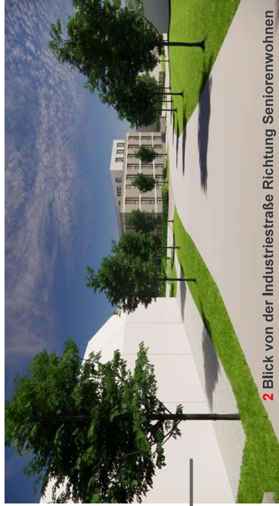
2 Blick von der Industriestraße Richtung Seniorenwohnen