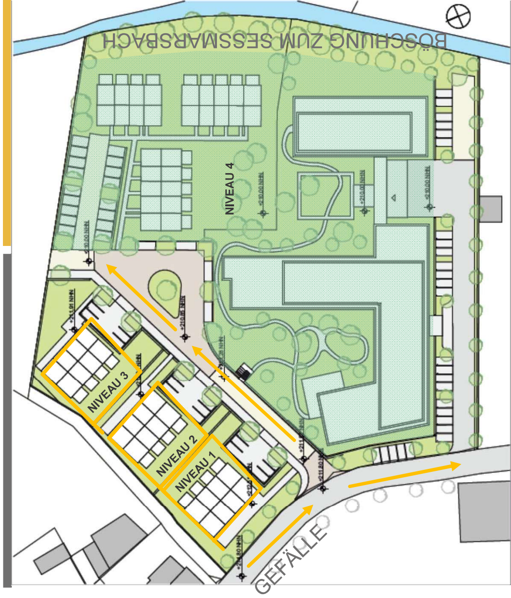
LAGEPLAN MIT HÖHEN