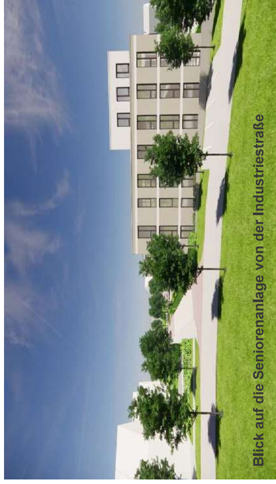
Blick auf die Seniorenanlage von der Industriestraße