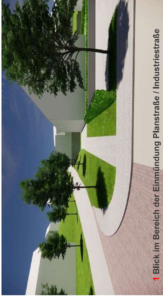
1 Blick im Bereich der Einmündung Planstraße / Industriestraße