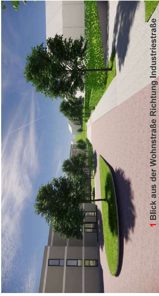
1 Blick aus der Wohnstraße Richtung Industriestraße