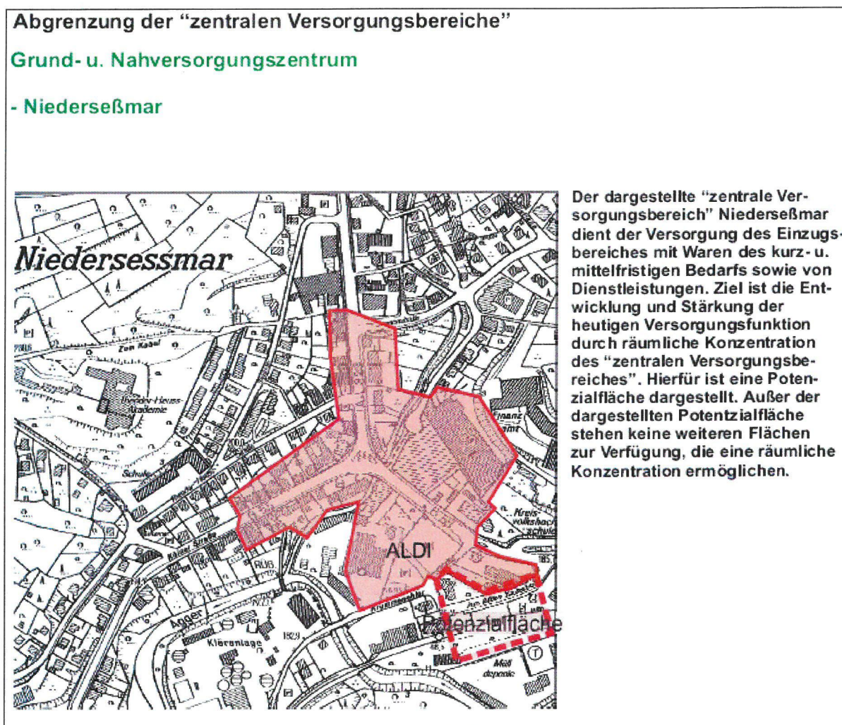
Auszug aus dem Einzelhandelskonzept der Stadt Gummersbach

Der Planbereich des Vorhabenbezogenen Bebauungsplanes Nr. 19 „Niederseßmar–Am alten Bahnhof / Einzelhandelsansiedlung“ liegt im zentralen Bereich des Ortsteiles Gummersbach – Niederseßmar. Der Planbereich liegt zudem innerhalb der Abgrenzung des „Zentralen Versorgungsbereiches Niederseßmar“, entsprechend dem Nahversorgungs- und Zentrenkonzept (Einzelhandelskonzept) der Stadt Gummersbach in den Beschlussfassungen des Rates der Stadt vom 02.12.2008 und der 1. Ergänzung vom 09.02.2010.