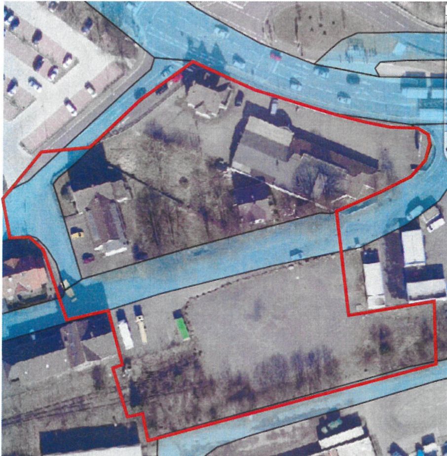
Auszug aus dem Luftbild

Der Planbereich wird derzeit unterschiedlich genutzt. Im nordwestlichen Teil befinden sich auf den Flurstücken 1175 und 3283 zwei Wohnhäuser. Auf dem Flurstück 3283 befindet sich zudem ein Getränkemarkt. Südlich grenzt an diese beiden Flurstücke die städtische Straße Am alten Bahnhof an. Der übrige, südliche Teil des Planbereiches liegt als ehemalige Bahnfläche derzeit weitgehend brach.