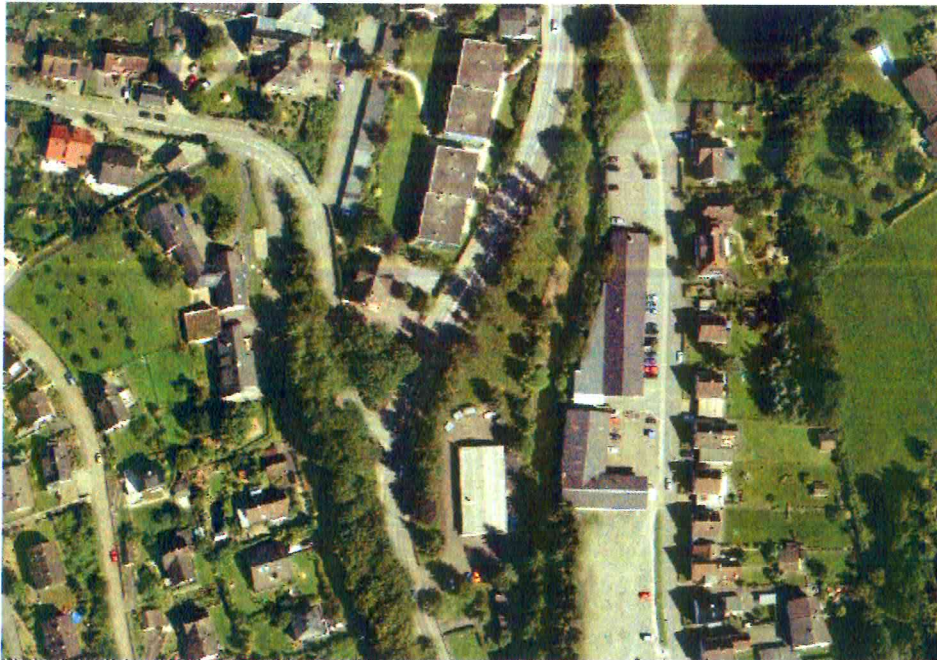
Übersicht Luftbild 2010

Das Umfeld des Plangebietes wird entlang der Klosterstr. durch eine gemischt genutzte Bebauung (Wohnen, Handwerk, Dienstleistungen, ...); geprägt. Auf der Westseite grenzt der Verlauf der Agger an. Westlich der Agger befindet sich eine Einzelhandelsnutzung sowie eine Reifenhandel bzw. -montagewerkstatt.