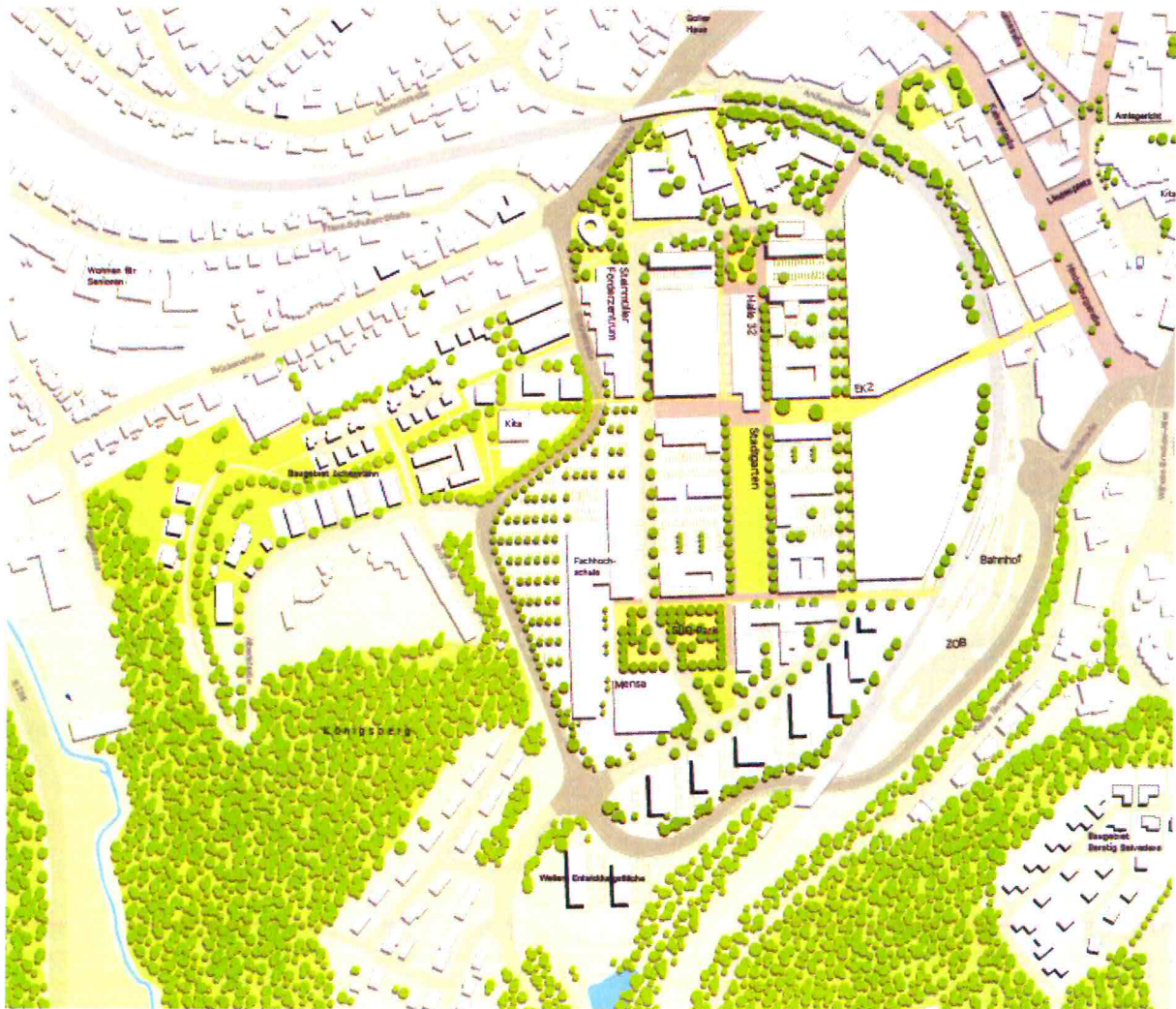
Rahmenplanung Stand 2010

Im Rahmen dieser Flächennutzungsplanänderung soll der Standort für das geplante Einkaufszentrum vorbereitet werden.